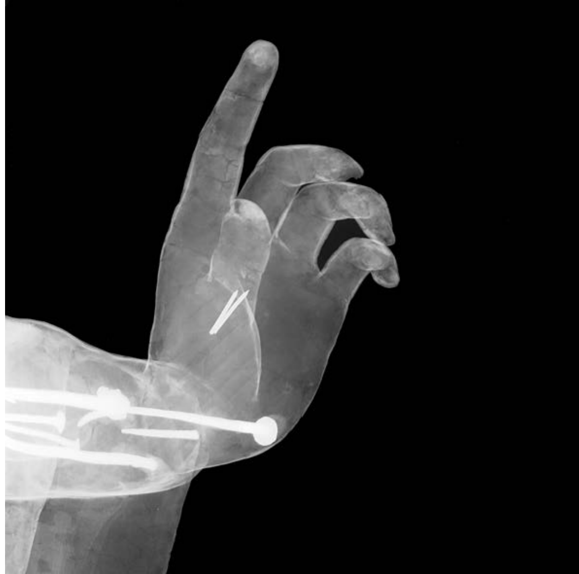
il dito e la luna